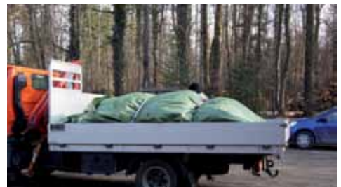
Transport de plantes bien protégé