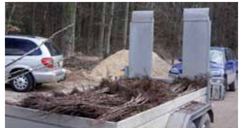
Renoncez absolument au transport non protégé

Pour transporter des plantes à racines nues, il faut absolument s'assurer que les racines soient bien couvertes avec des couvertures de laine humides, du jute, du tissu épais, des étoffes ou des bâches. Durant le transport, les plantes ne devraient être exposées ni au soleil ni aux courants d'air. Elles devraient en outre être protégées du gel.