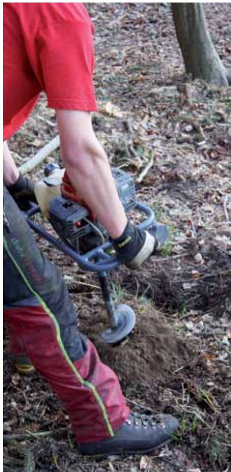
Tarière à un opérateur