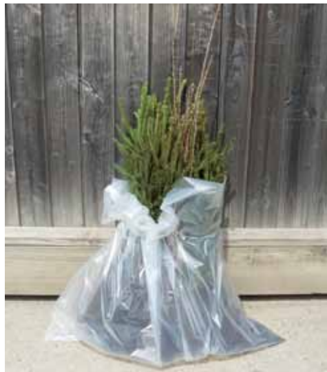
Entreposage à court terme

Si la durée d'entreposage est courte (3-5 jours), les plantes peuvent être placées dans un sac plastique dans un endroit frais, à l'abri des rayons du soleil et du vent (p. ex. garage ou cave). Il faudra maintenir l'humidité des racines.