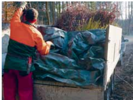
Entreposage, transport et distribution en forêt