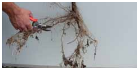
Taille des racines au sécateur