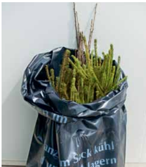
Entreposage à court terme

Le sac fraîcheur pour les plantes s'est révélé être un moyen simple et avantageux dans ce but. Les racines y sont protégées contre les rayons du soleil et le vent, alors que le sac lui-même est léger.