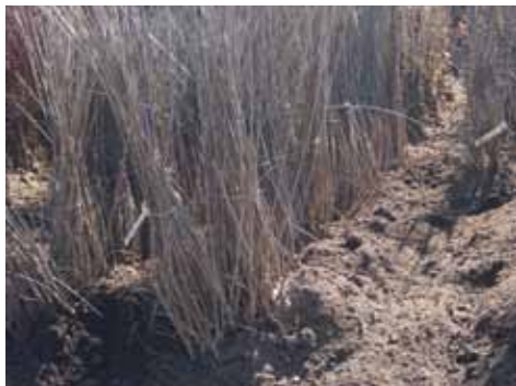
Entreposage à long terme en exploitation

Si des plantes doivent être plantées d'année en année (entreposage de plus de 3-5 jours), il est recommandé de préparer une exploitation (p. ex. avec de la sciure humide ). Celle-ci devrait être placée de préférence à un endroit ombragé, protégé du soleil (p. ex. dans un perchis ou du côté nord d'un édifice). Les plantes devraient être clôturées pour les protéger de l'abrouissement. Elles peuvent être aussi plantées directement près de la zone de plantation, mais il faudra s'assurer que le matériau d'isolation des racines reste friable, permettant ainsi une couverture hermétique des racines. Si le matériel d'isolation est grossier et grumeleux, des cavités se formeront, laissant l'air arriver aux racines qui pourraient se dessécher.