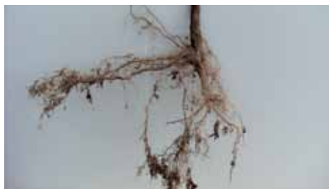
Taille des racines adaptée à la pousse

Il est important d'adapter la méthode de plantation à la plante et à ses racines. Il arrive souvent qu'on adapte les racines à la méthode de plantation, c'est-à-dire que les racines soient coupées pour qu'elles correspondent à la procédure de plantation. Cette procédure doit absolument être évitée.